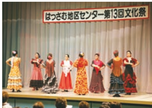
▲はっさむ地区センターの舞台発表