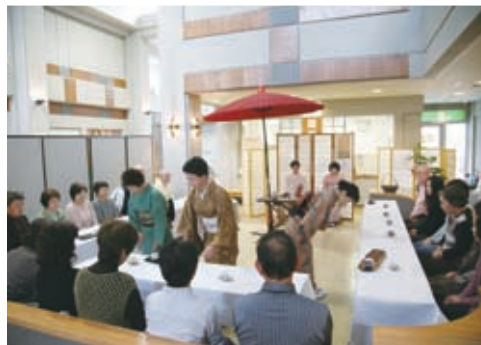
▲西野地区センターで行われた「お茶席」