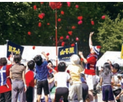
▲南円山地区大運動会の様子

これは、先人がさまざまな苦勞を重ねて現在に至ったことを、地域の人たちが忘れることなく今も脈々と受け継いでいるからです。 その中心となる南円山連合町内会では各種団体と連携して、地域の課題に取り組み、いろいろな行事を開催しております。中でも、今年で三十八回を数える大運動会、敬老会、防災訓練などの行事や催しが頻繁に行われ、古くからいる住民と新たに住民になられた方々が一緒に参加し、交流が盛んに行われておりま