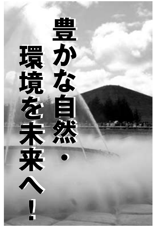
モエレ沼公園は、ごみ埋め立て地の

ちょっとした工夫と心掛けで、皆さんもごみダイエット名人に。ごみを減らして、 街に、地球に優しい暮らし を始めましょう。