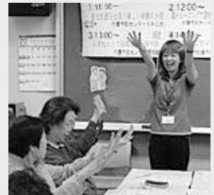
すこやか倶楽部体験の様子

厚別区役所保健福祉課保健支援係でも、介護予防や療養上の相談に応じています。☎895-2400内線463、362、363