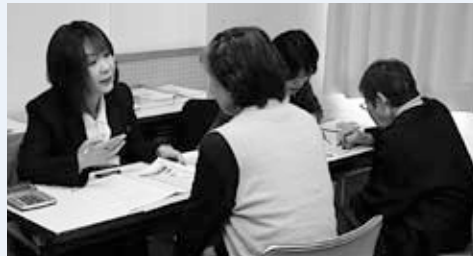
介護予防相談の様子

少し体が弱ってきた高齢者が安心して住み慣れた地域で暮らせるように、介護予防サービスの相談や計画の作成を行っています。高齢者の生活全般についての相談を受け、消費トラブルや虐待などの問題から高齢者の権利を守るお手伝いをしています。