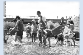
あしりべつ川体験塾 【8月18日(土)】