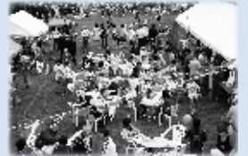
北野ふれあい夏まつり 【7月28日(土)】

本年度、区内のさまざまな行事が10周年記念行事として開催されています。これまでに行われたいくつかの行事の様子をご紹介します。