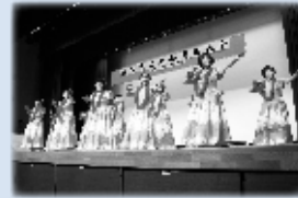
文化芸能発表会 【6月16日(土)】