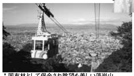
↑ 国有林として保全され眺望も美しい藻岩山