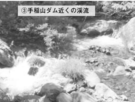
③手稲山ダム近くの溪流