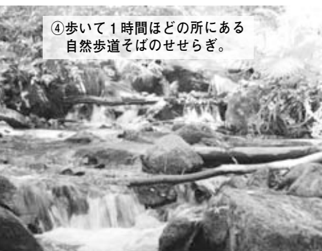
④歩いて1時間ほどの所にある 自然歩道そばのせせらぎ。