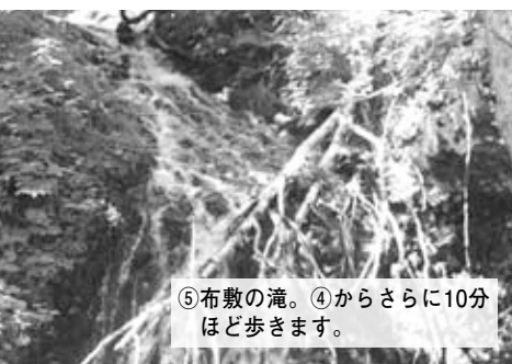
⑤布敷の滝。④からさらに10分 ほど歩きます。