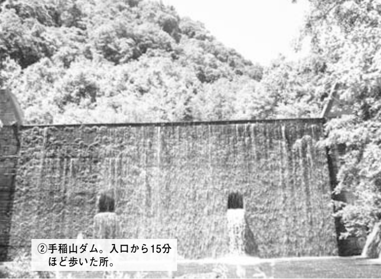
②手稲山ダム。入口から15分 ほど歩いた所。

朝からじりじりとした日差しが降り注 そんなとき、水辺にたたずんで川の らぎを聞いたりすると、いっとき暑さ 今月は、見ているだけで涼を感じら