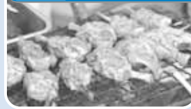
滝川市 骨付きラムステーキ

ラム肉をたれにつけこんだ味付けジンギスカンは、滝川が発祥の地。骨付きラムステーキも、たれと肉汁が混ざり合い絶妙な味わいです。