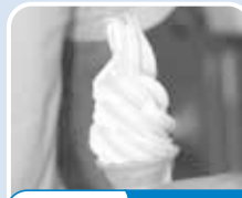
黒松内町 ソフトクリーム

身が甘く、味が濃いのが毛ガニの特長。豪快に1匹丸ごと入った毛ガニ汁は、カニのうま味がたっぷり!