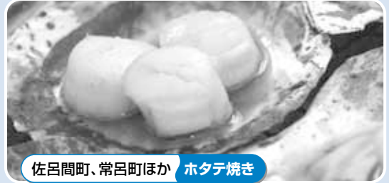
佐呂間町、常呂町ほか ホタテ焼き

開催日時 9月1日(土) 午前9時~午後6時 9月2日(日) 午前9時~午後5時 ※各店舗は、売り切れ次第終了 会場 大通公園西5丁目~8丁目