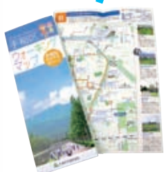
▲ウォーキングマップ

と き：9月8日(土) 10:00～14:00 と ころ：区民センター、保健センター