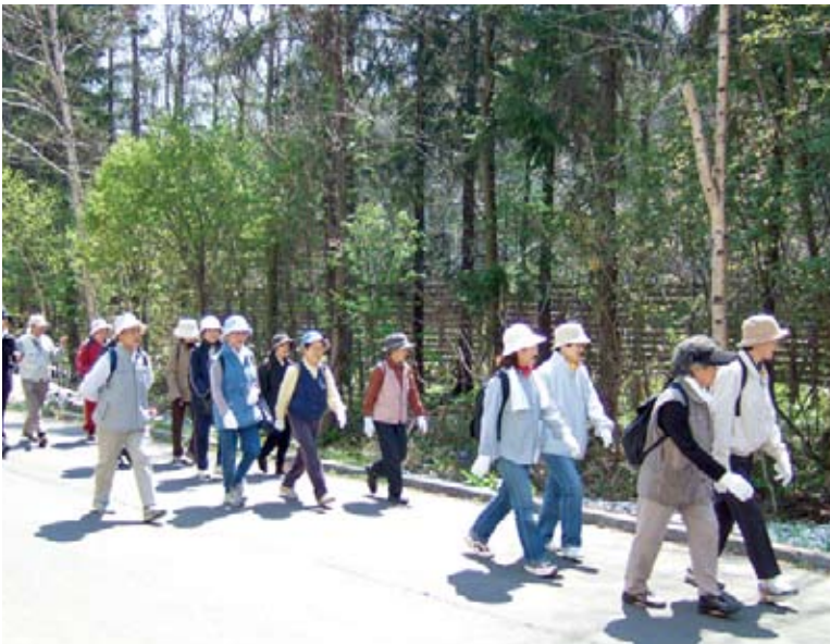
▲ウォーキングを始めてみませんか

健診結果、腹囲測定でメタボリックシンドロームの疑いがあるという方は、運動と食生活を見直しましょう（治療中の方や要治療となった方は、主治医の先生にご相談ください）。