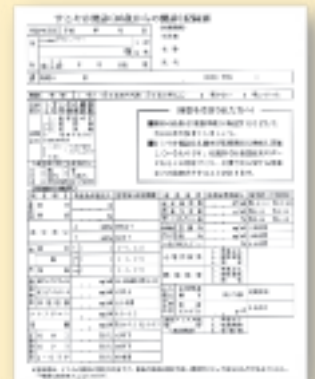
▲すこやか健診記録票