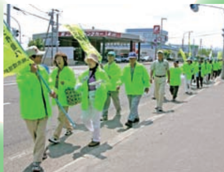
▲不法投棄撲滅を訴え、4.6kmの道のりを進みました

出陣式には、5月25日に「不法投棄撲滅緊急宣言」を行った上田文雄市長も駆け付け、激励のあいさつをしました。