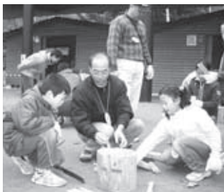
▲自然を通して子どもと大人が ふれあいます

青少年山の家は、国営滝野 すずらん丘陵公園内にある野 外活動施設。自然の中の野 団宿泊生活や野外活動など を通して、心身共に健全でたく ましい青少年を育成すること を目的としています。 主に学校の宿泊学習で利用 されていますが、一般の方 も広く開放しています。 また、キャンプやハイキン グ、ボランティア研修会など も行っています。本誌全市版 で随時募集案内を掲載しま すので、ぜひご参加ください。