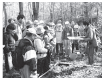
▲山の家周辺や公園内の自然観察 を行うハイキング