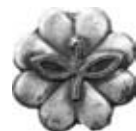
▲民生委員・児童委員さんの「バッジ」。