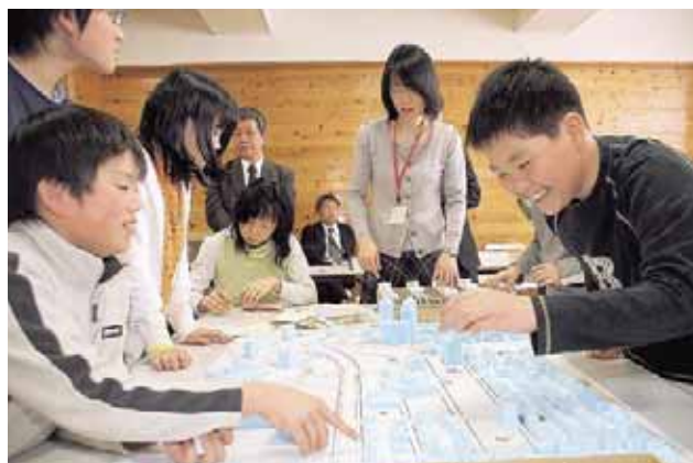
2月20日 親子で学ぶ 「まちなみルール体験講座」