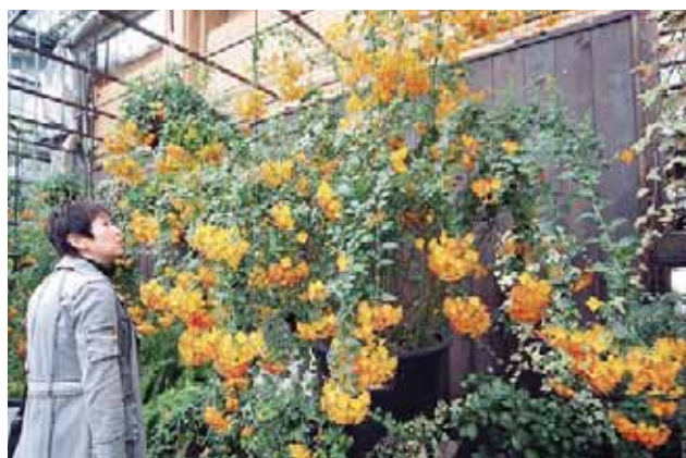
3月6日 温室は一足早く春到来 満開の「マーマレードブッシュ」