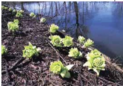
春の訪れを告げる1枚(茨戸川周辺にて。平成18(2006)年4月下旬)

りという具合。ふとした瞬間、カメラのファインダーをのぞき、シャッターボタンを押す。現像してみても『こんなふう撮れてたんだ』とか『ちょっとイメージと違った』なんてこともたくさんあります。でも、それがとても楽しくって」