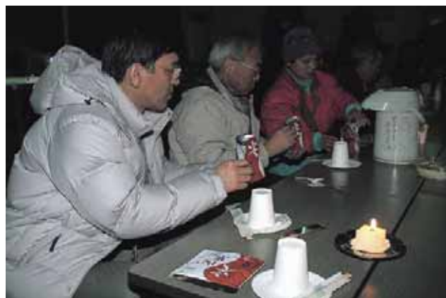
3月2日 非常時を体験 ひまわり連合自治会防災会「冬季防災訓練」