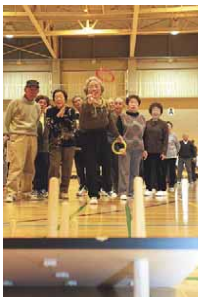
2月22日 北区老人クラブ連合会「スポーツ・レクリエーション大会」