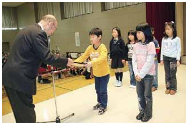
3月4日 褒めてはぐくむ温かい心 「篠路地区善行表彰式」