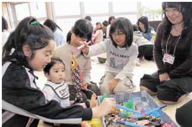
2月27日 小学生と乳幼児が交流 「あいまるクラブ」プレオープン