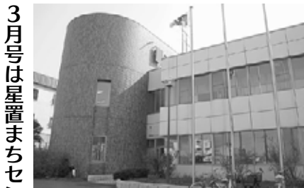
▲手稲まちづくりセンター ☎681-2131

ボランティア」を、平成17年から実施しています。お年寄りの見守りと、住民間の交流を深める、ご近所ならではの取り組みです。 砂まきボランティア また、手稲中央小学校の5、6年生のうち、希望する児童が登下校時にベットボトルに入れた砂を、凍結した通学路にまく「砂まきボランティア」を平成18年から行っています。自分たちだけでなく、次に通る人が転倒しないための取り組みです。