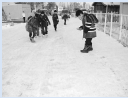
▲凍結した通学路に砂をまく小学生

厳しい冬の到来。この時期、雪対策は地域にとって最大の課題と言っても過言ではありません。手稲山のふもとからJR手稲駅の南口まで広がる手稲本町地区では、冬を楽しみ、そして安心・快適に暮らせるように、地域の人たちが知恵を出し合い、力を合わせてまちづくりをしています。