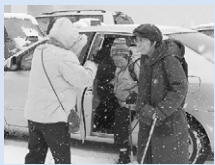
▲お年寄りと一緒に買い物へ

買い物ボランティア 坂道が多い手稲本町見晴台南町内会には、75歳以上の高齢者の世帯が多く、冬になると転倒が心配で外出しない方が増えています。そこで町内会では、気心の知れている町内会の人たちが、お年寄りと一緒に買い物に行く「買い物