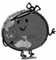
「アースデイ北海道2007」の公式キャラクター「ババンバ・アース君」

今年6月21日から7月1日まで、道東の屈斜路湖畔で開催される「アースデイ北海道2007」には、私たちも運