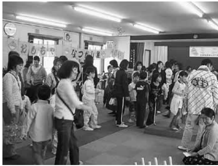
「健康キッズCOM」ミニ緑日

私たちは、「心と身体の健康」「自分の健康は自分で!!」をスローガンに掲げて、北栄連合町内会の区域を4つの「島(アイランド)」に分け、幼児からお年寄りまでを対象に、きめ細かな活動を進めています。