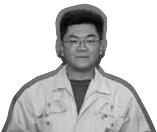
ひがしかわ 東川 南地区除雪センター長

除雪作業へのご理解とご協力をお願いします。 除雪に関する問い合わせ先などは、区版6ページをご覧ください。