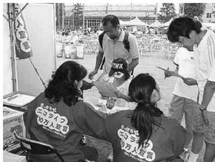
「hanna (はな)」の活動風景(昨年8月、中央区の市電フェスティバルにて)

「ストップ・ザ・温暖化」キャンペーンの一環として、環境家計簿「STOC」の普及や、「さつぽろエコライフ10万人宣言」の市民への啓発、総合環境イベント「環境広場さつぽろ」への参画、地球環境をテーマにした講演会の開催など、幅広く活動しています。