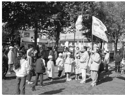
「健康キッズCOM」防犯教室

防犯・交通安全教室などの行事を通して、未来を担う子どもたちの健全育成に少しでもお役に立てたらと考えています。