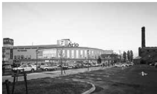
サッポロビール博物館 (写真右側の建物) の隣りです!

今年、さらに多くの皆さんにCOMEの活動に触れてほしいと願い、会場を東区民センターから『アリオ札幌』に。発表の形態に合わせて「市民活動情報ブースエリア」、「パフォーマンスエリア」、「体験ブースエリア」の3つの会場を設けます。ご家族そろってお気軽にご来場ください。