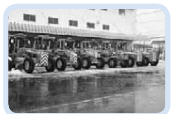
さまざまな除雪車が並んでいます