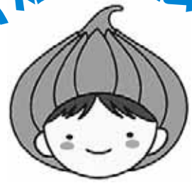
東区マスコットキャラクター「タッピー」