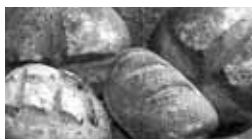
↑道内産小麦を使用した手作りのパン

時間:午前8時~午後8時(土・日曜、祝日は午前10時~午後7時) 場所:地下鉄大通駅東西線コンコース(定期券発売所横)