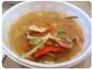
さとらんどで採れた野菜を使った「さとらん豚汁」

さとらんど交流館内で、有名ホテルが北海道産の食材を使った料理を提供。休憩所としても利用できます。