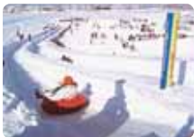
ゴールははるか彼方。ぐるぐる回転しながら約20秒間の滑走!