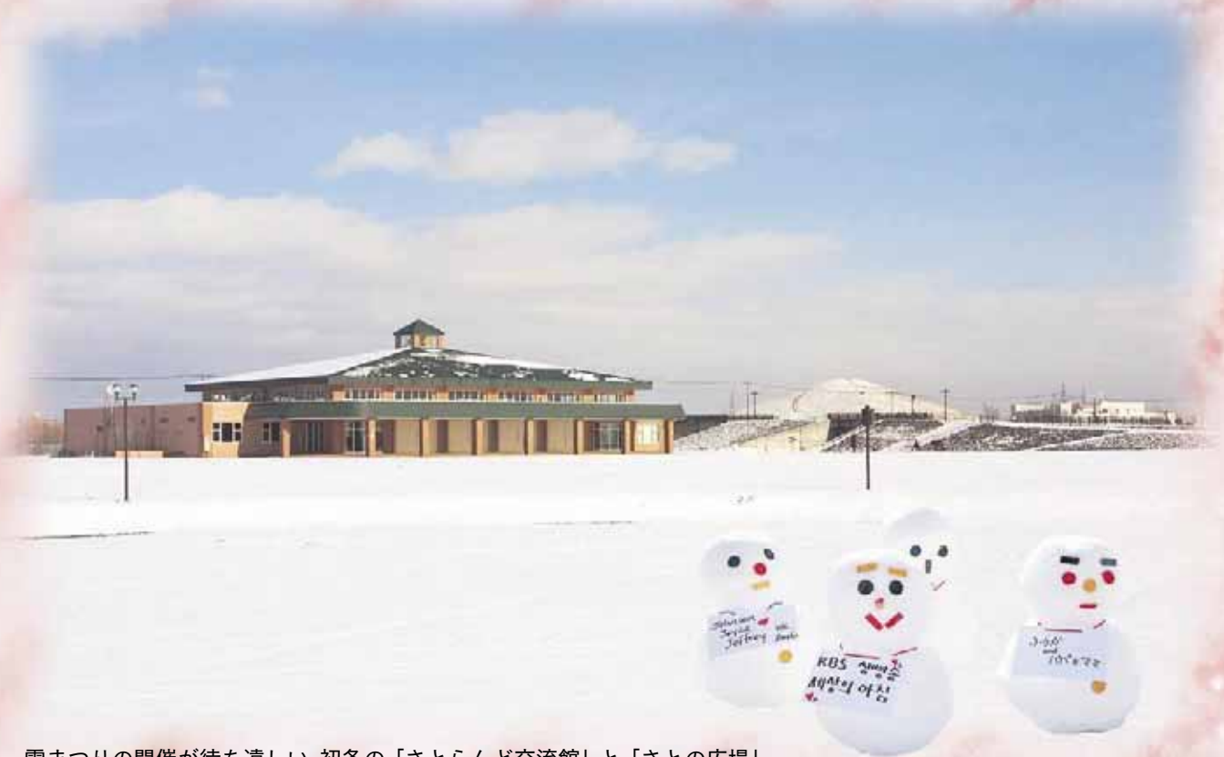
雪まつりの開催が待ち遠しい、初冬の「さとらんど交流館」と「さとの広場」