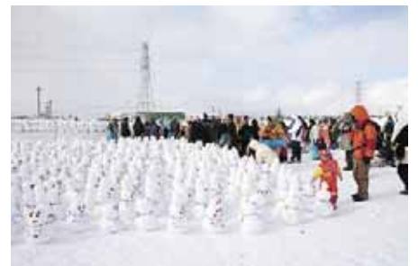
力を合わせて作った2,800個の雪だるま