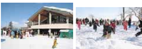
さとらんどセンター前に集合！