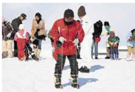
札苗地区の皆さんが企画した竹スキー