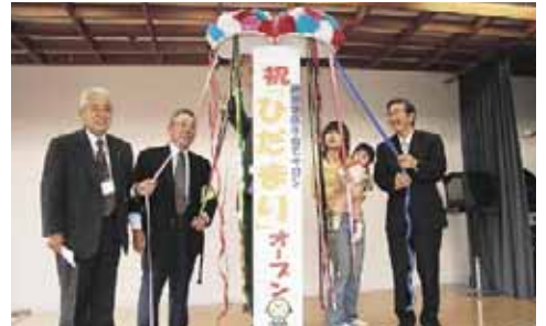
▲鉄東地区子育てサロン「ひだまり」オープン(11/10)