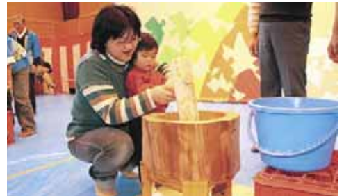
▲苗穂連合町内会「ふれあいもちつき大会」(12/3)