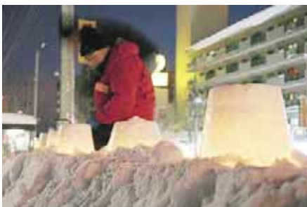
ウエルカム 栄東地区のWelcomeスノーキャンドル

※このページに関するお問い合わせは、ウェルカム協議会事務局（東区役所内）☎741-2400へ 開催日程、会場までのアクセス方法などの詳細は、本誌8頁をご覧ください。