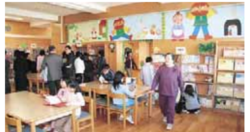
▲栄南小地域開放図書館「たねまき文庫」オープン(11/30)