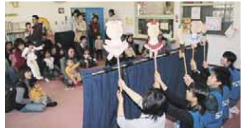
▲子育て日曜サロン(11/19・ひのまる児童会館)