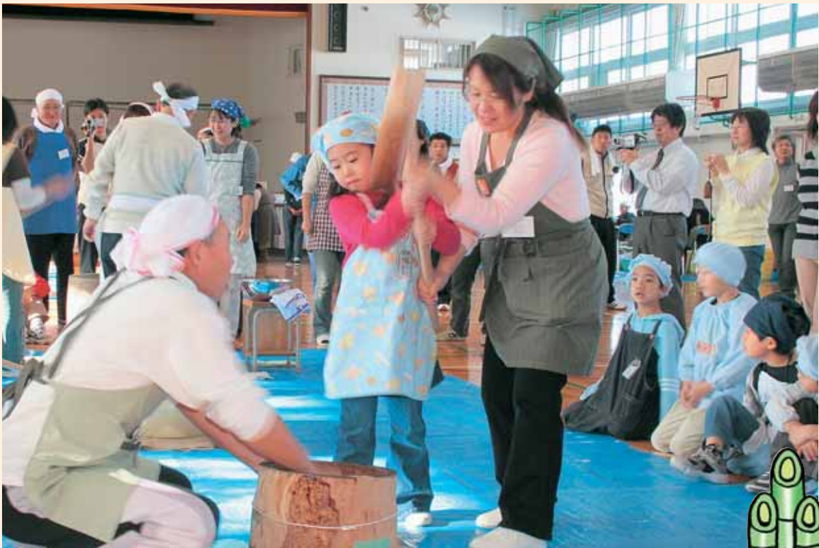
▲共栄小学校ふれあいもちつきの会 (12/8) この日の模様は、厚別5号発信まちづくりセンターに 詳しく掲載していますので、ご覧ください。