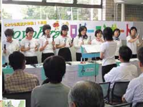
▼とよひらロビーコンサート(9/14)：福住小学校PTAによるハンドベル演奏。心が洗われました。