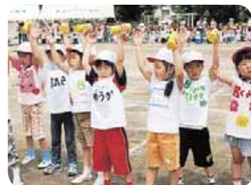
ミッドアイランドを踊るなかのしま幼稚園の園児たち