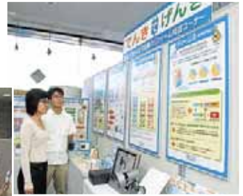
▲でんきでげんき展(9/20～26)：安心・安全な住まいがテーマ。便利だな～。