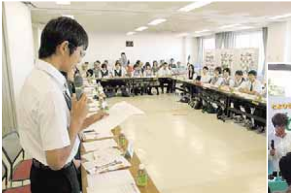
▲生徒会サミット(9/2)：区内の中学生が情報交換。地域活動にもっと参加するぞ!