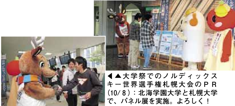
◀▲大学祭でのノルディックスキー世界選手権札幌大会のPR(10/8)：北海学園大学と札幌大学で、パネル展を実施。よろしく!