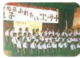
親子ふれあいコンサートで披露される「月寒の少年」

小樽のレコード収集家のもとで見つかった「月寒の少年」は、「幻のレコード発見!」と地元で大きな話題を呼びました。牧童を主役