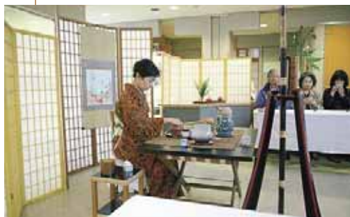
▲西野地区センターで行われた「お茶席」

各会場では、書道などの作品の展示やお茶席、フラダンスや日本舞踊などの華やかな舞台発表が行われ、各センターで活動するサークルが、日ごろの成果を披露。訪れたたくさんの観客を楽しませていました。