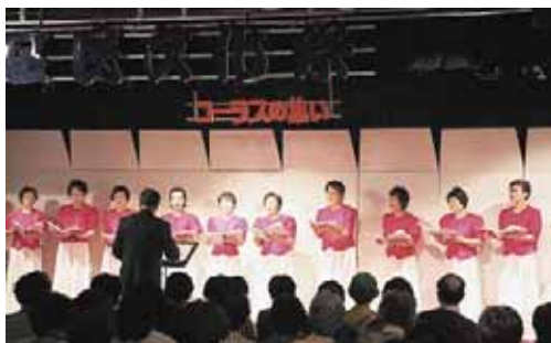
▲西区民センターの「コーラスの集い」