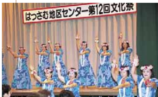
▲はっさむ地区センターの舞台発表

介護保険についてのパネル展示のほか、健康にまつわる川柳の作品展、北大落語研究会のメンバーによる落語も披露されました。介護をテーマにした大喜利に会場から大きな笑い声と拍手が起こりました。