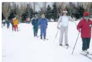
歩くスキー教室の様子

また健康・子ども課では、一月下旬に四回一コースで歩くスキー初心者教室を行いますので、初めての方でも安心して始められます。日程・内容につきましては、区民のページ四ページをご覧ください。なお、歩くスキーをお持ちでない方には、スキーやスキー靴の貸し出しも行いますので、この機会に歩くスキーを始めてみませんか？