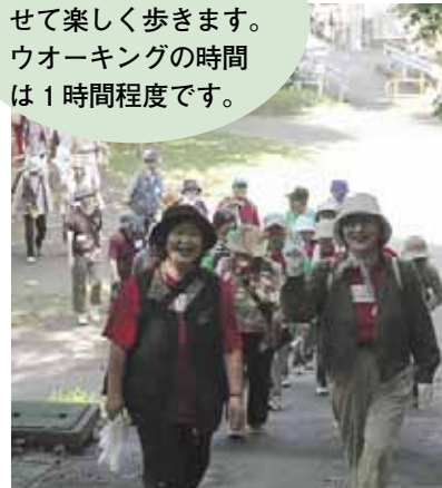
昨年のウォーキングの様子

月寒公園内を経験(健脚者、初心者)に合わせ楽しく歩きます。ウォーキングの時間は1時間程度です。