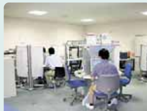
無料の職業紹介サービスを受けられます