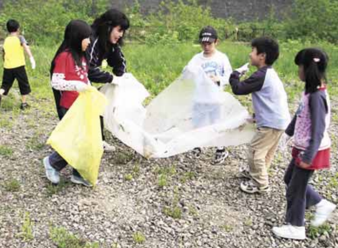
石山児童会館「ゴミ ゼロ 0隊出動！」 子どもたちはごみ拾いを遊びに 変えてしまった。集めたごみは 2袋。きちんと分別していた。