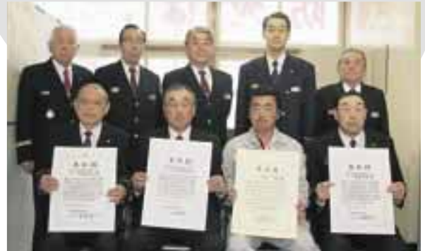
▲誇りを胸に、晴れ晴れしく

自宅で洗車中に火災に気付いた京屋さんは、消防団員とともに川から小型ポンプを使って水をくみ上げ、延焼を最小限に食い止めました。