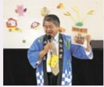
▲平成17年南区 タウントークの様子