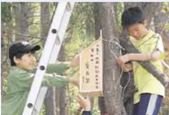
▲しっかり固定して小鳥も安心

藤の沢小学校に隣接する自然豊かな森「小鳥の村」で「小鳥の村開村50周年記念第48回愛鳥祭」が行われました。児童の代表が木に巣箱を取り付け、その後全員で森の中を散策。児童たちは鳥の鳴き声に耳を傾けたり、姿を見つめたりして大喜びしていました。