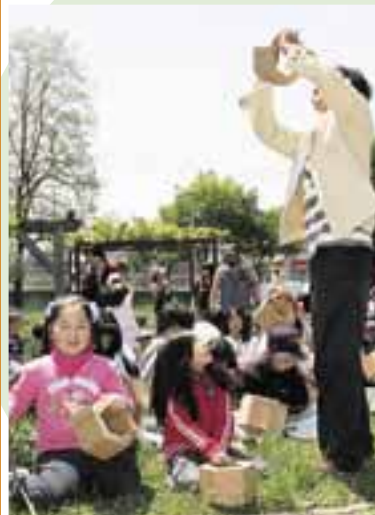
▲うまくできたかな？

藻岩下公園（通称・パンダ公園）で「第1回パンダ公園フェスティバル」が開かれ、地域の子どもから大人まで約200人が参加。さまざまなゲームを楽しんだり、再生ダンボールを使った植樹法「カミネッコン」について学んだりして、充実した一日を過ごしました。