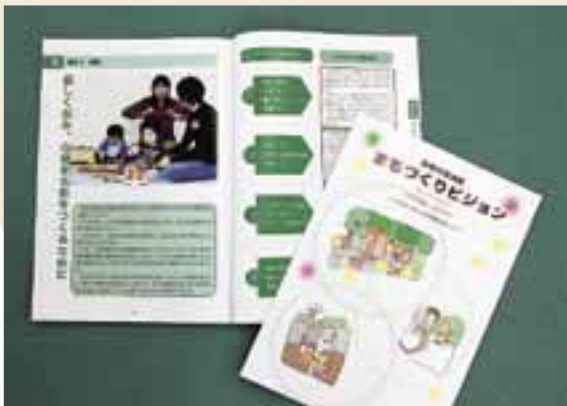
▲親しみやすい仕上がります

芸術の森地区の住民がこれからのまちづくりについて考え策定した「まちづくりビジョン」が完成しました。デザインは同地区の市立高等専門学校の学生が協力。地域の自然・文化・福祉の3つの視点ごとに「10年後の夢の姿」を描いています。