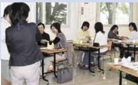
▲これで子どもも大喜び

南保健センターで子育てボランティア講習会が開催されました。どういう場所が危険かをクイズ形式で学んだり、子どもが大好きな手遊びをしたりして、参加者も楽しみながら受講していました。