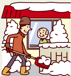
高齢の方や障がいのある方の 自宅を除雪する地域住民