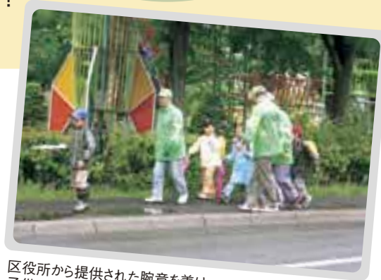
区役所から提供された腕章を着け、子供たちの見守りをするパトロール隊