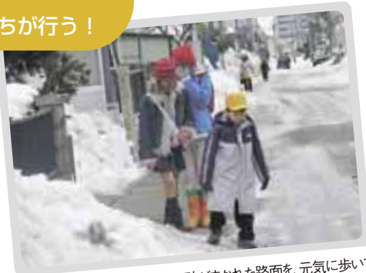
砂がまかれた路面を、元気に歩いて学校に向かう子供たち

PTAの皆さんが中心となり、子供たちの転倒を防ぐため、地域内のツルツル路面に砂をまく活動。子供が滑って交通事故に遭いそうになったことから、平成15年に始まりました。除雪センターが学校に配布した砂を、サポーターが気付いたときにまきます。雪解け後には、砂の清掃活動も一斉に行います。