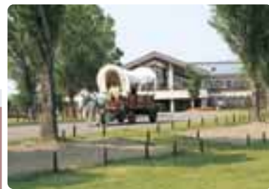
駐車場が土日でも無料になるなど、サービスが充実したさとらんど

新しくオープンしたレストランがお気に入りです。無農薬の野菜を使っていて子供にも安心！これからの季節、新しい動物が増えたふれあい牧場で、子供と遊ぶのが楽しみです。