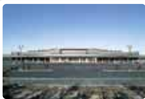
山口斎場の整備運営を通じて、PFIのノウハウを蓄積していきます

とは、公共施設などの建設を民間企業の資本や技術力を活用して行う新しい手法。建設後の運