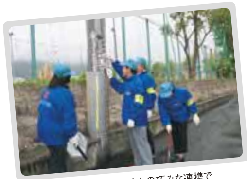
ビラをはがす人と清掃する人との巧みな連携で作業する曙地区の皆さん

行政ではなかなか手の回らなかった、地域内の違法な張り紙、張り札、立て看板を除去する活動。まちの美観を保とうと、平成16年からアダプトプログラムを利用して始めました。区役所から、活動用具の提供や保険の加入について支援を受け、約130人のメンバーで、町内会ごとに活動を行っています。