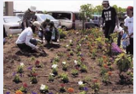
昨年度の花トピアの取組みの様子。

区内の小・中学校に花の苗を提供し、地域団体と児童・生徒が協力して、校庭の花壇づくりや学校周辺の緑化を行うことで、地域団体と学校との交流の機会を増やし、地域の子どもを見守る意識を高めていきます。