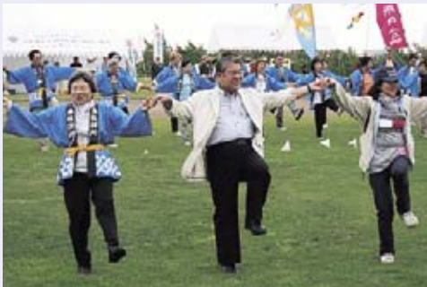
昨年度の東区さわやか健康まつりは、上田市長が飛び入り参加。一緒に東区音頭を踊りました。