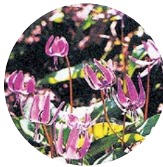
「厚別東の自然」のページ掲載写真から～春のカタクリ～