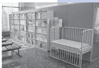
パンフレットコーナー