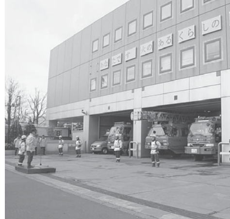
南郷通側は厚別消防署になります。

札幌市では、区役所のまちづくり支援の強化や保健福祉部の機構改革を行うこととし、厚別区役所の窓口配置を4月から一部変更しました。来庁時に窓口が分からない場合は、気軽に職員にお尋ねください。