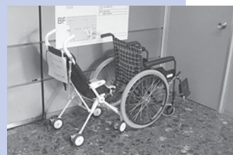
出入り口の車いすとベビーカーは自由にご利用ください。