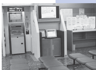
市民情報端末「さっぽろeビジョン」