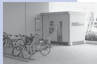
古紙回収ボックス（新聞・雑誌・段ボールを持ち込めます）