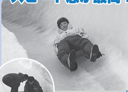
↑ 全身で氷を感じるリュージュ

リュージュなどの本格的そり競技が楽しめるのは、長野市と「フズスノーエリア」だけ!