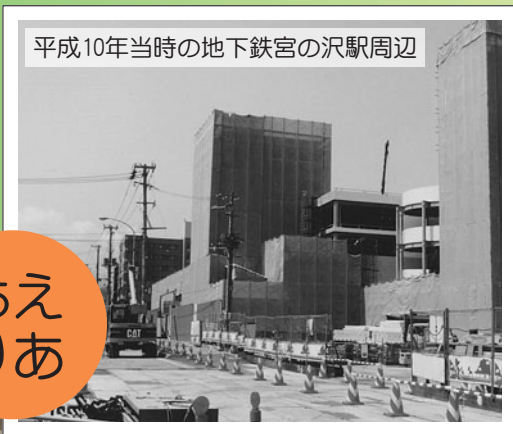
平成10年当時の地下鉄宮の沢駅周辺

平成17年には、屯田兵入植130周年を迎えたことを記念して「かがやけコトニ〜屯田兵の里まつり」が行われました。