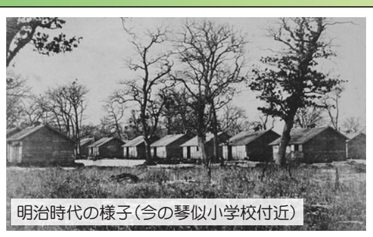
明治時代の様子(今の琴似小学校付近)

明治8年、北海道で初めて屯田兵が琴似に入植してから、琴似屯田兵村の中央道路として発展しました。