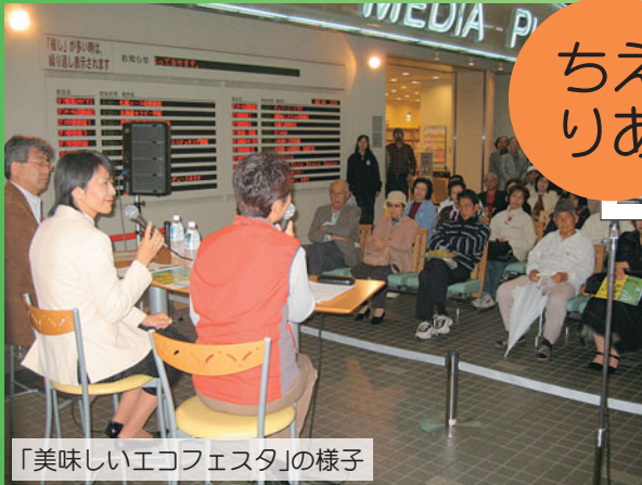
「美味しいエコフェスタ」の様子

札幌市生涯学習総合センター(ちえりあ)は、リサイクルプラザ宮の沢などの複合施設として、平成12年8月にオープンしました。