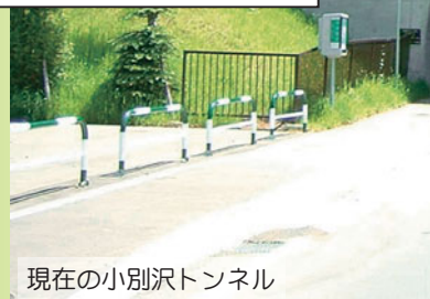
現在の小別沢トンネル

参考文献：札幌市教育委員会・札幌市 さっぽろ文庫44「川の風景」、48「札幌の山々」、58「札幌の通り」、74「わが街新風景」