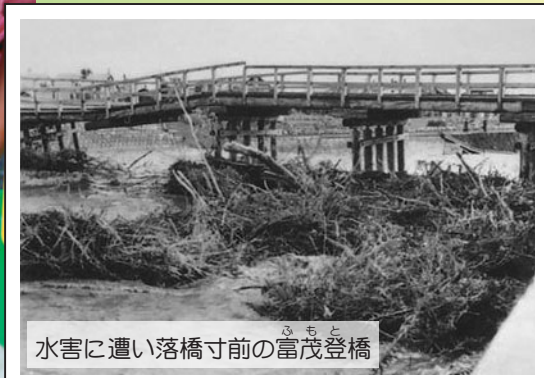
水害に遭い落橋寸前の富茂登橋