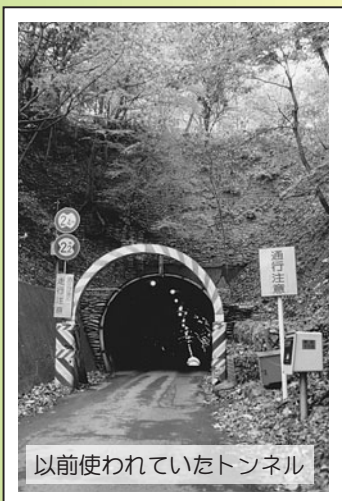
以前使われていたトンネル