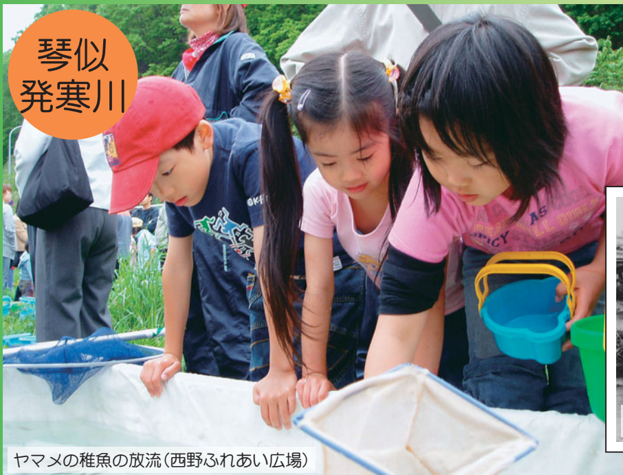
ヤマメの稚魚の放流(西野ふれあい広場)

手稲山を源として、西区の中心部を流れるこの川は、過去には度重なる水害に悩まされていましたが、今では川沿いに数多くの憩いの場が整備されています。