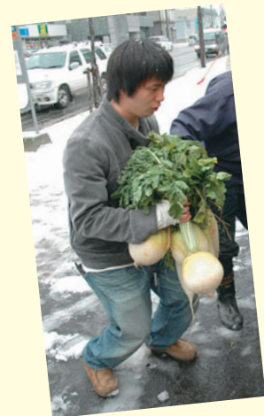
▲力仕事もお手のもの