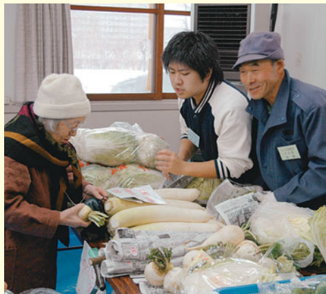
▲新鮮でおいしいですよ

北海道東海大学の学生3人が、「いしやま朝市」で就業体験を行いました。前日には朝市開催のチラシも配り、やる気十分。「売れ残らないように気合を入れてがんばります」という言葉どおり、お客さんとの会話を楽しみながら、積極的に励み、実践的なまちづくりを学びました。