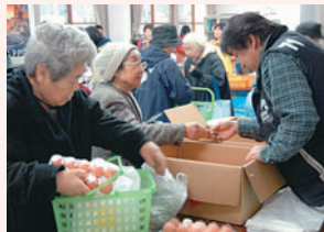
いらっしやい！新鮮な卵ですよ～