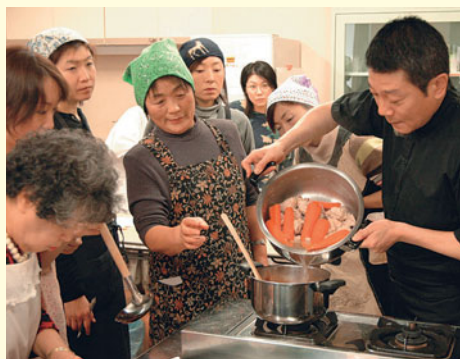
▲家でも同じようにできるかな？

すみかわ地区センターでスープカレー作り講座が開かれました。7倍を超える応募者の中から選ばれた料理好きの16人が、地元到店を構える「木多郎」の店主からプロの味を教わりました。スープやスパイスなどは家庭で作やすいように工夫。完成したスープカレーのおいしさに、皆さん大満足でした。