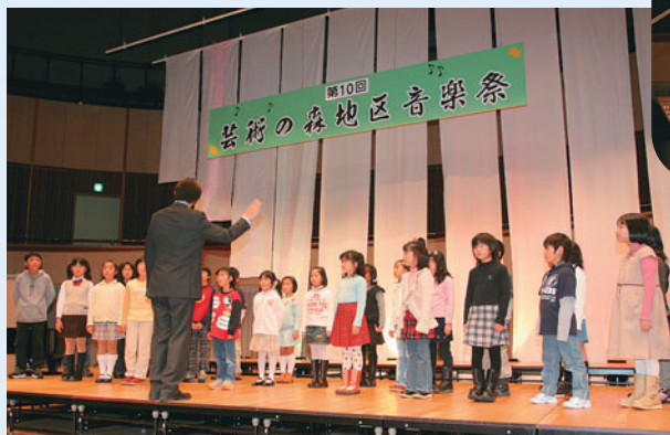
▲心を込めて一生懸命歌いました

札幌芸術の森アートホールで、「第10回芸術の森地区音楽祭」が開かれました。地域住民が音響や照明などを担当する、まさに手作りの音楽祭。幅広い年代の出演者たちが合唱や和楽器、吹奏楽などの演奏を披露し、美しい音色が会場いっぱいに響き渡りました。最後は出演者と観客全員が心を一つに合わせ「ふるさと」を合唱しました。