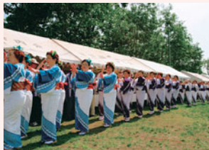
藤野地区では藤野音頭を○○○ます。