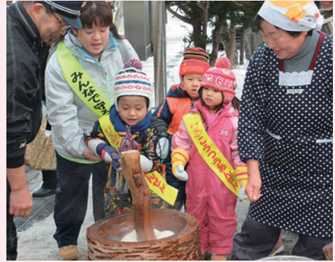
▲無事故の願いを込めて、ぺったん！