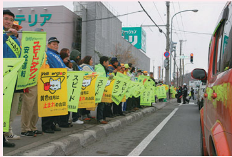
▲スピードダウンで安全運転 運転を呼び掛けました。

藻岩地区の国道230号沿線では「交通安全ファイナル啓発」が行われ、各地区から約420人が参加し、安全