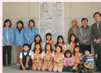
▲わが街の防災マップ完成！