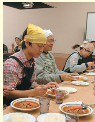
▲みんなで楽しく試食です