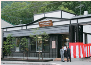
定山溪温泉博物館が併設されています。