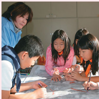
▲ここにもがけがあるんだね

川沿少年消防クラブが、わが街をチェックしようと防災マップを作成しました。避難所や川などを色付けしたり、事前に調べた、通学路や自宅周辺の「歩道が無い道」や「急な階段」のある所を書き込んだりしました。完成したマップを見て、あらためて身近にある危険個所を認識しました。