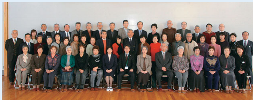
▲チャレンジ精神を忘れずに、これからも学び続けます

南区民センターを会場に、南区緑苑大学（高齢者教室）の修了式が行われました。受講した50人全員が修了証書を受け取り、たくさんの思い出を胸に半年間の大学生活を振り返っていました。修了生の多くはOB会に参加し、これからも交流を深めます。