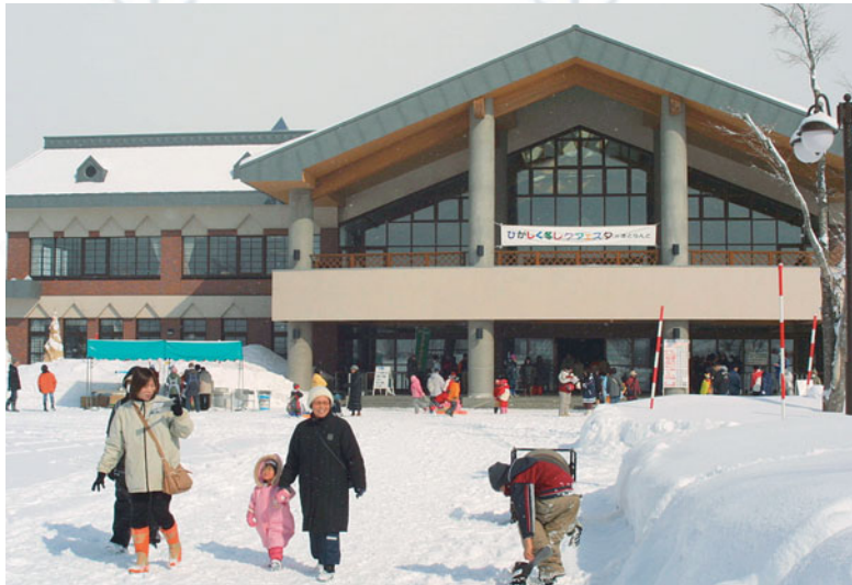
↑さとらんどセンター前に集合！

毎年、2月下旬に開催していた「ひがしく冬レクフェスタ」は名前を変え、「タッピー冬レクフェスタ」となって、雪まつり期間中の2月11日(祝)に開催します。 さとらんどセンター前のハルニレ広場で、午前11時～午後2時まで行います。 家の中に閉じこもることが多い季節です。この日は、雪の上で体を動かして、冬の日を楽しみましょう。 皆さんの参加をお待ちしています。