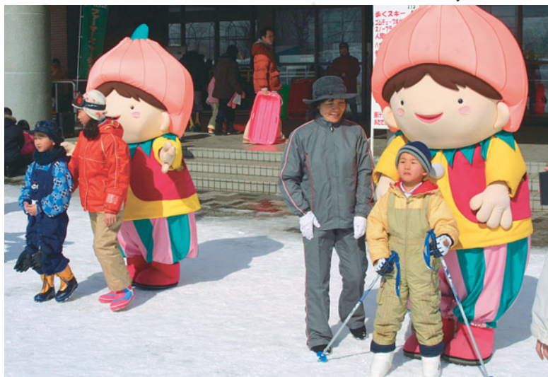
↑人気者のタッピーと記念撮影ができます

今年も、スノーフラッグ大会、人間ばんば競争、タッピー記念撮影や餅つき大会、試食コーナーもありますよ！