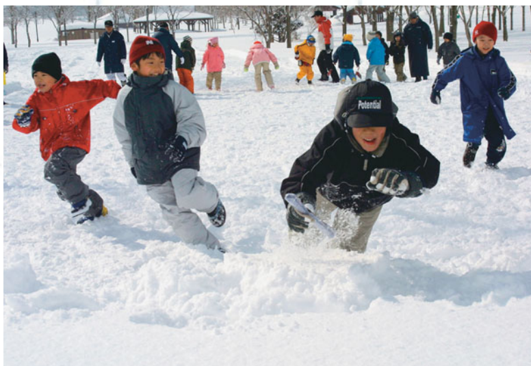
↑スノーフラッグ。全力で走って旗をつかみます