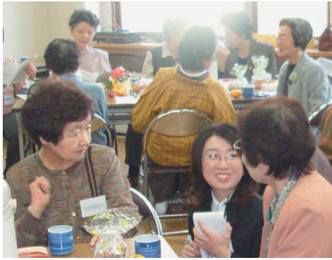
地域の方とのコミュニケーションを大事にしています。

この催しは、自宅にこもりがちなお年寄りに外に出てもらい、地域の人々と親睦を深めてもらうことを目的に十年前から行われており、厚別中央地区の社会福祉協議会、福祉のまち推進センター、民生委員児童委員協議会と厚別区保健福祉部が共同で実施しています。平成十四年までは一会場のみで開催でしたが、地域によっては遠くへ参加しにくいという声があり、