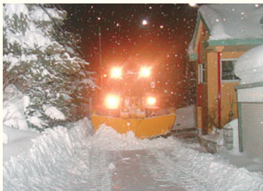
一晩の出動で、全車で合計約350キロメートル(札幌から網走市までの距離に相当)の道のりを作業します。