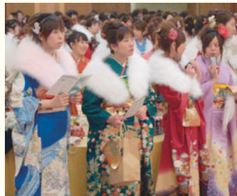
厚別区では今年約1700人の若者が成人となります。