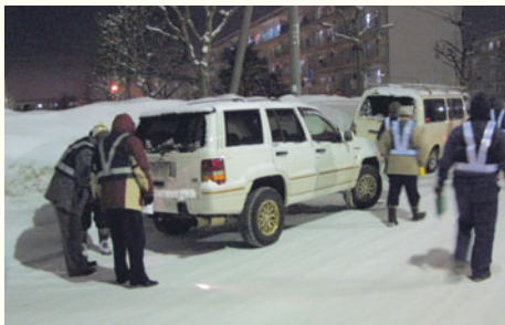
昨年のもみじ台地区のパトロールの様子です。

特に冬の積雪期は除雪車による作業の妨げになり、多大な迷惑を及ぼすので路上に□□□□□□したままにしないようにしましょう。一月末から各地区で町内会や厚別警察署などが協力して、違法□□□□□□防止の夜間パトロールを実施する予定です。