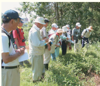
川の源流まで歩いて観察しました。