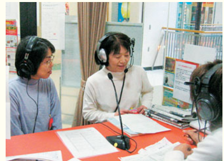
区民の方が熱心にお話して下さいます。