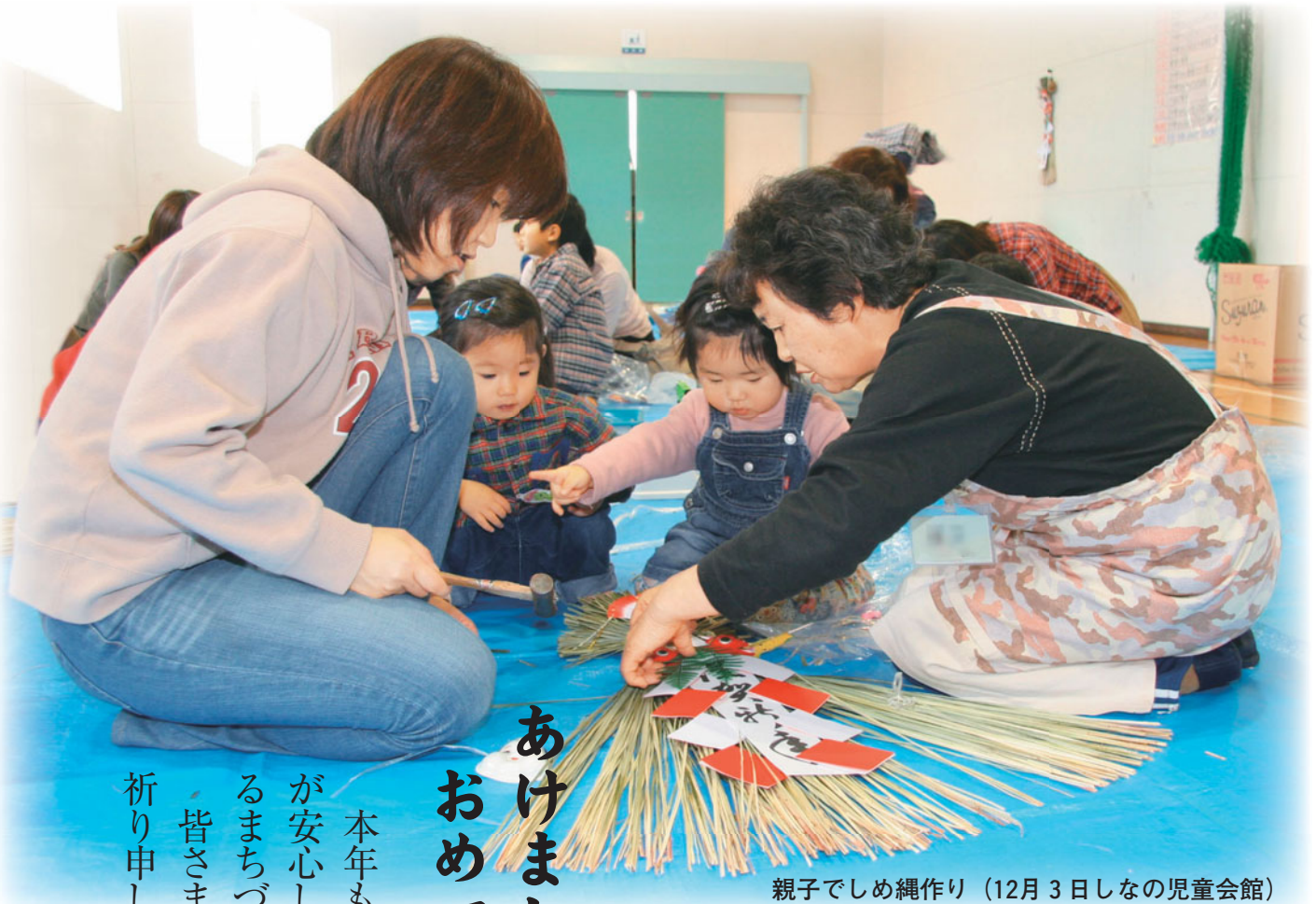
親子でしめ縄作り（12月3日しなの児童会館）