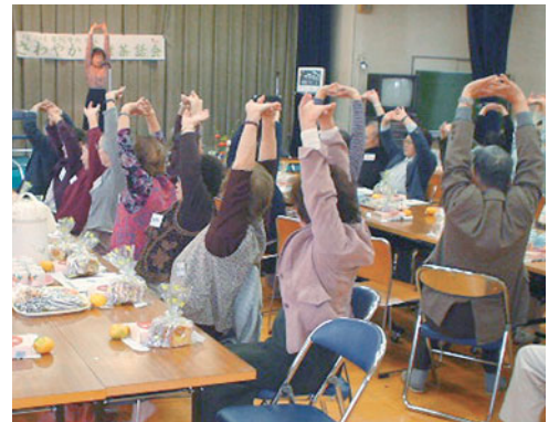
いすに座ったままできるストレッチ体操で、軽い運動をしてもらいます。

平成十五年からは旭町会館、厚別会館、ひばりが丘東集会場、ひばりが丘西集会場の四会場で行うようになりました。参加人数も年々増え、平成十七年は百三十八人の参加がありました。開催に当たっては、民生委員が中心となり、対象者一人一人に直接参加を呼び掛けています。