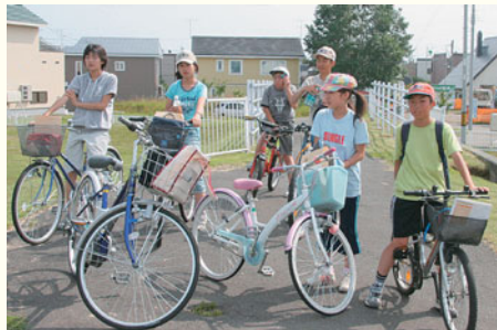
2005年9月号子ども記者の皆さん。

白石区と北広島市につながる白石サイクリング□□□□ではサイクリングやウォーキングを楽しむことができます。