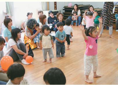
上野幌中央会館のわんぱくひろばの様子です。

児童会館や地域の集会施設で開かれている子育て□□□□。乳幼児を連れてお母さんが気軽に集まっておしゃべりしたり、子どもを遊ばせたりできる場です。