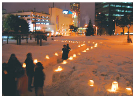
▲昨年のキャンドルナイトの様子

区内のまちづくりの輪を広げ、副都心のにぎわいを生み出すため、この冬「新”さっぽろ冬まつり」と題して新しいイベントを開催します。新さっぽろの冬をみんなで楽しむための手作り感覚の新しい冬のまつりです。