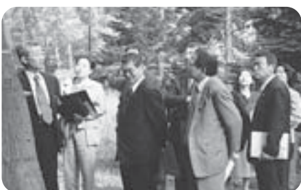
豊平公園で陳情に関する現地調査をする環境消防委員

配布場所 市役所2階市政行政物コーナー、区役所、まちづくりセンター、地下街ふれあい広場。