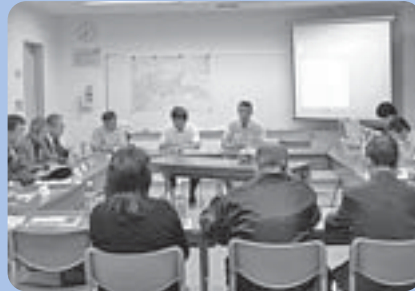
北区で行われた町内会と土木センター職員の意見交換会の様子

※住所、氏名、年齢、電話番号を記入してください。下記のHPからもご意見を受け付けています。