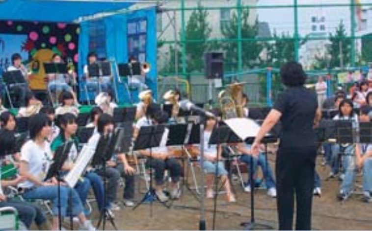
▲稲積中の生徒による演奏が祭りを盛り上げました