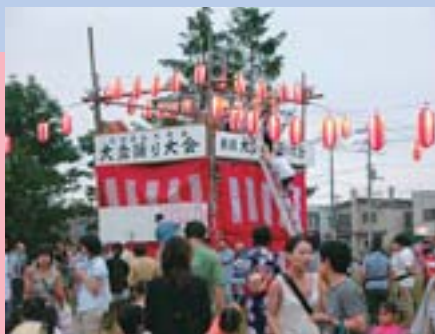
▲恒例となった仮装盆踊り。 さあ、あなたも踊っていない？