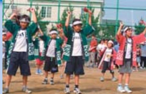
▲ポーズ決まったでしょ？