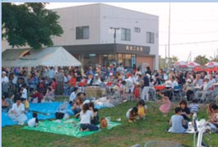
▲曙地区として初めて行われるお祭りにたくさんの人が押し寄せました