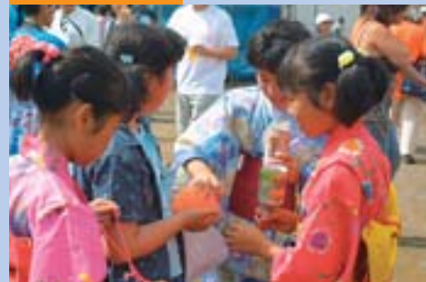
▲縁日での買い物も楽しみの一つです