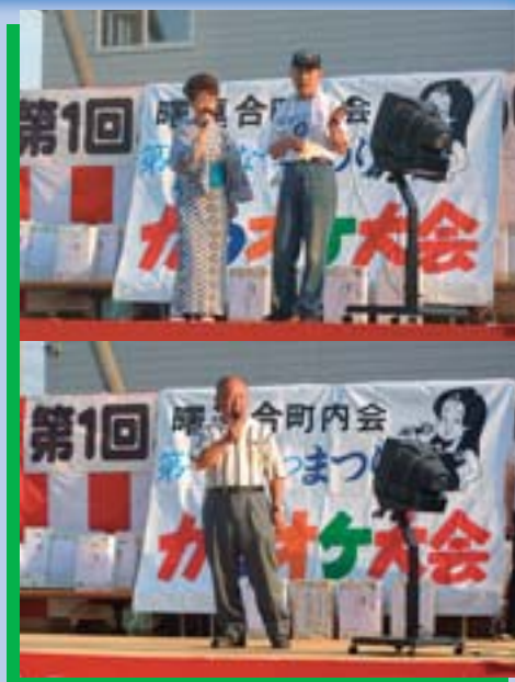
▲自慢の歌声を披露中