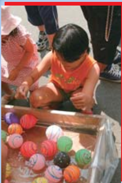
▲風船を釣るのは難しいなあ