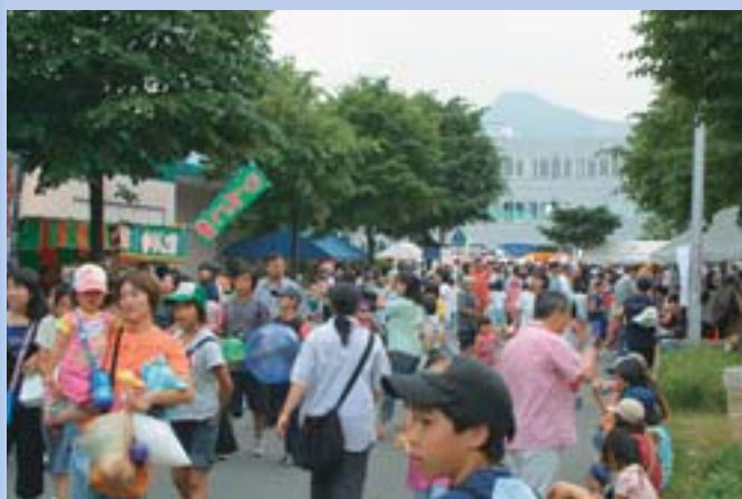
▲会場はたくさんの人で賑わい、様々なイベントが行われました