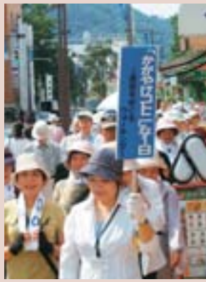
「かがやけコトニな一日」のウォーキングや屯田兵の食事体験