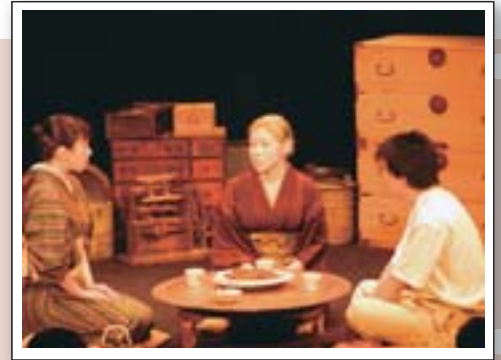
八軒物語3「新・すえ語り」公演(ターミナルプラザことにパトス)