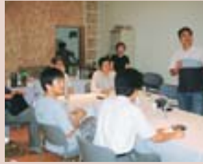
「夜なべ談義」(レッドベリースタジオ)