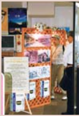
なつかしのコトニ「写真パネル展」(JR琴似駅)