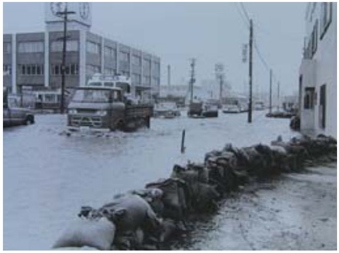
昭和40年（1965年）台風24号による大雨で冠水した旧国道5号（二十四軒1-7付近）

近年、異常気象による風水害や大規模な地震が数多く発生しています。今月号では、区内の避難場所をお知らせします。いざというとき、慌てないために、日ごろからお近くの避難場所と道順を確認しておきましょう。