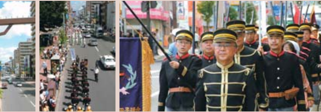
飾ったフラッグ パレードの様子 パレードの様子 この屯田兵服やウェルカムフラッグなどは、宝くじ助成事業の助成を受けて製作されました。

8月27日(土)～9月4日(日)、琴似地区などで行われた 「かがやけコトニ～屯田兵の里まつり」 イベントの様子を写真でお伝えします。