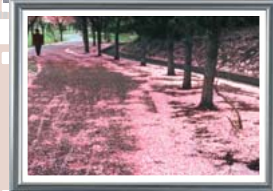
テーマ：後世に遺したいコトニの風景

二十四軒小学校では、琴似神社の写生に取り組みました。琴似小学校では、壁新聞の作成や、「かがやけコトニ」のポスターを作成するなどし、それぞれ、地下鉄琴似駅や区民センターに展示されました。 写真 左：区民センターでの作品展示 中：地下鉄琴似駅メトロギャラリーでの作品展示 右：屯田兵屋で琴似小児童が行った生活体験会