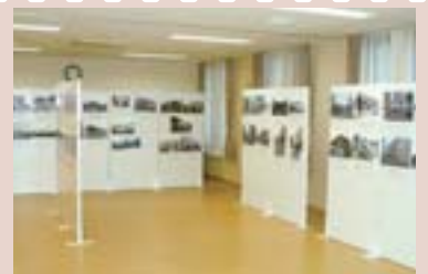
八軒の歴史パネル展(八軒会館)