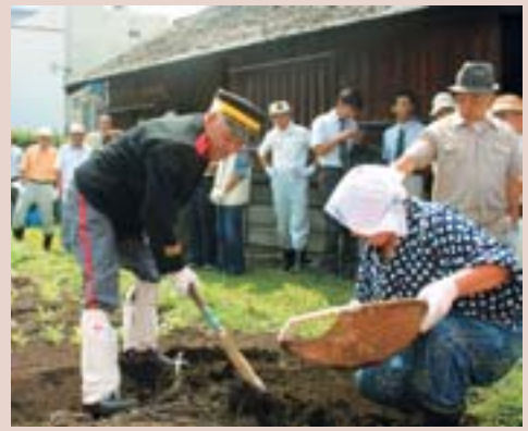
ふるさと琴似屯田兵村菜園事業で収穫祭(琴似屯田兵村兵屋跡)