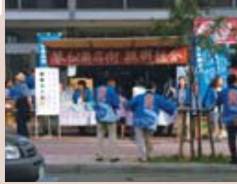
琴似商店街感謝祭(琴似本通ほか)