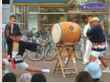
琴似アートdeバザール琴似本通り(琴似本通ほか)