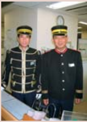
JR琴似駅の駅員も屯田兵の扮装で協力