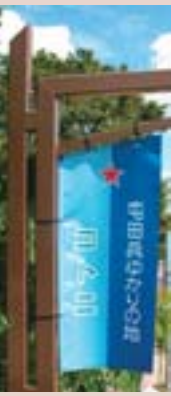
琴似本通をウエルカム