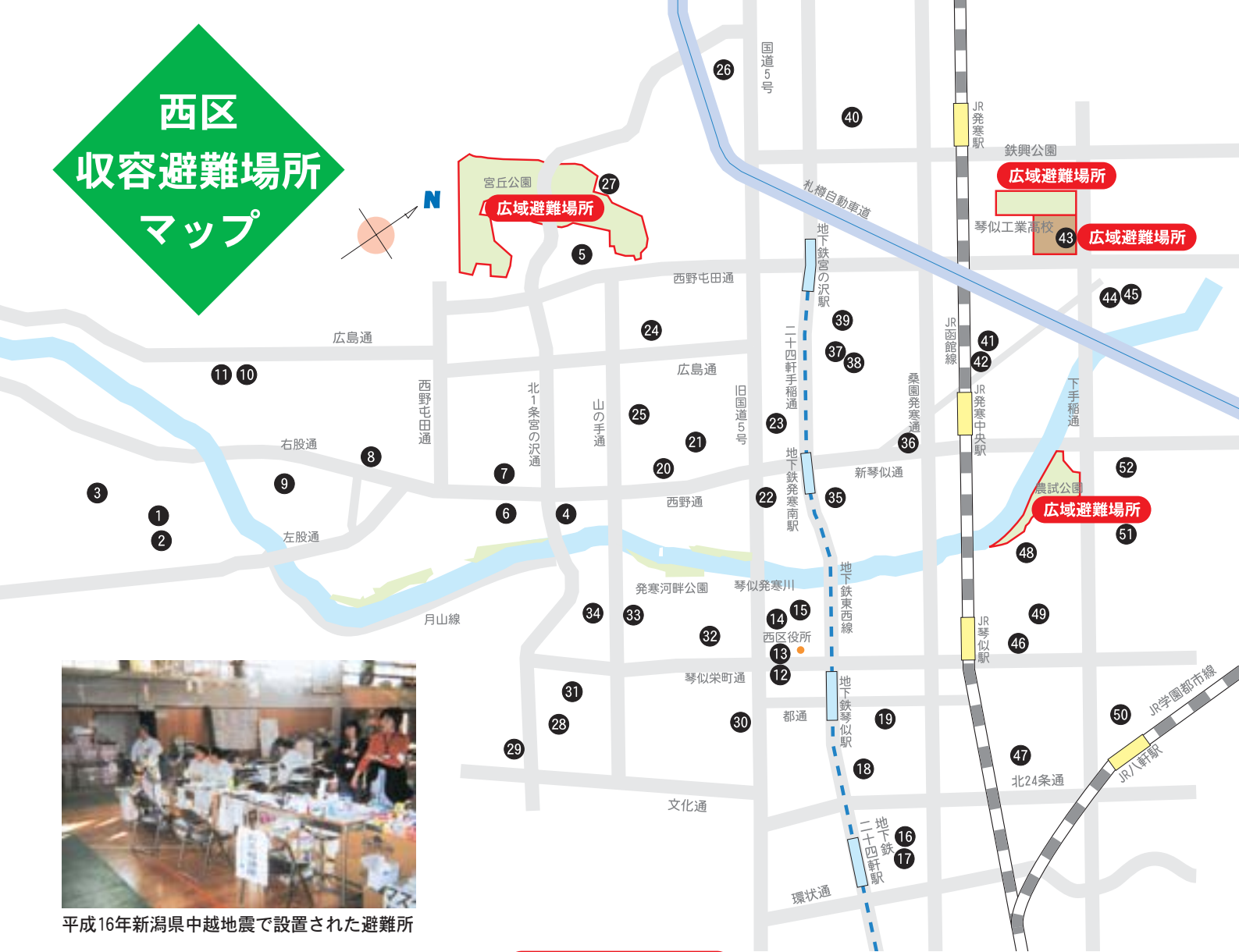
平成16年新潟県中越地震で設置された避難所