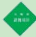
収容、一時避難場所

このほかに地域の公園など身の安全を確保する「一時避難場所」、大規模な火災が発生したとき、炎や煙から身を守り、安全を確保する「広域避難場所」があります。