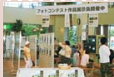
フォトコンテスト作品展示会(イトーヨーカドー琴似店)