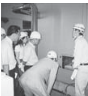
西部スラッジセンターを視察する建設委員