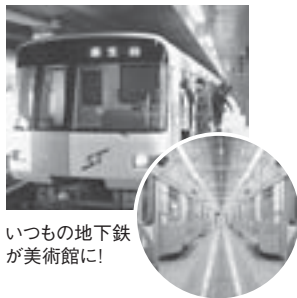
いつもの地下鉄が美術館に!