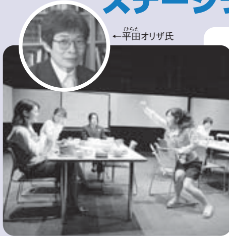
青年団「忠臣蔵・OL編」