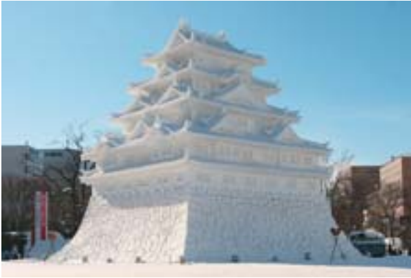
上：今年2月7日～13日に開催された第56回さっぽろ雪まつり（写真は名古屋城）