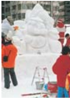
右：雪像をつくる市民。市民雪像は第16回（昭和40年）から導入され、毎年たくさんの市民が雪像づくりを楽しんでいます

来場者数の伸び悩みや、さらなるにぎわい創出のため、新たな魅力づくりが求められているさっぽろ雪まつり。今回、雪まつりの今後を市民の皆さんと一緒に考えるための「さっぽろ雪まつり市民フォーラム」を開催します。 市は、今年五月から、市民の視点で雪まつりの今後の在り方を考える「雪まつりワークショップ」を開催してきました。公募による市民三十人が五グループに分かれ、雪まつりの現状と課題、魅力アップへの取り組み、真駒内会場に替わる新会場の在り方などについて議論。七月二十七日の第五回ワークショップで、