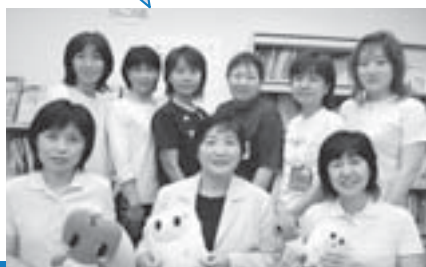
豊平区子育て支援担当スタッフ