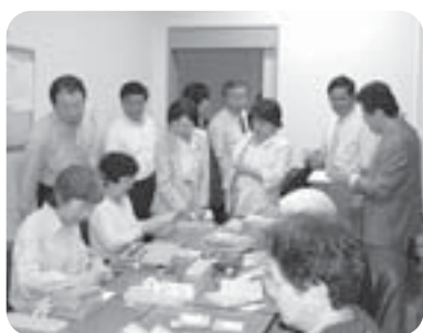
所管施設を視察する厚生委員 ～視聴覚障がい者情報センター