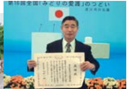
▲大阪府枚方市の表彰式会場にて