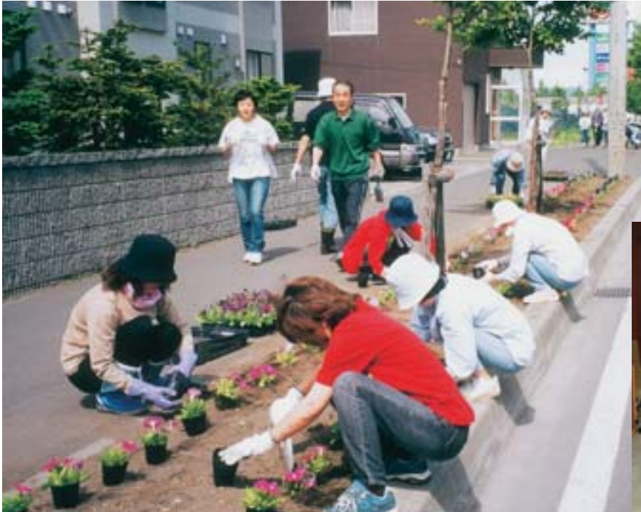
▲1年草を植え込む会員の皆さん