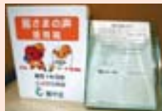
区役所1階正面玄関内の「皆さまの声」意見箱