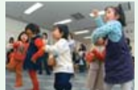
福住地区の子育て支援行事、「ふくふくキッズ」