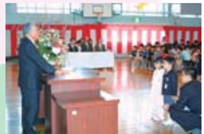
防犯ベルの贈呈の様子