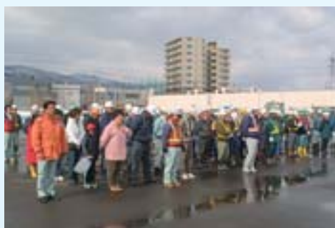
▲これから清掃に向かいます

「地域全体で子どもたちを守りたい」この思いが、子どもたちを守る大きな力となるでしょう。