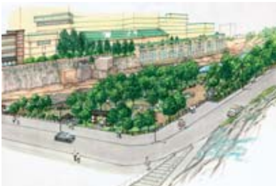
定山溪シンボルゾーン