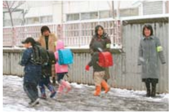
藤野の子どもを見守る運動