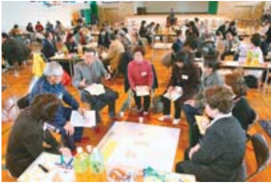
新石山まちづくり ワークショップ