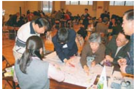
真駒内地区災害図上訓練