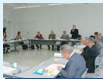
▲まちづくり活動報告会