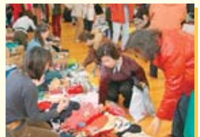
▲平岡地区で開催されたフリーマーケット