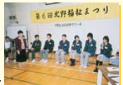
▲中学生による100秒スピーチ「僕たちわたしたちが考えるぎわのまち」

中学生や高校生による討論会などを開催し、子どもたちの視点によるまちづくりを進めています。