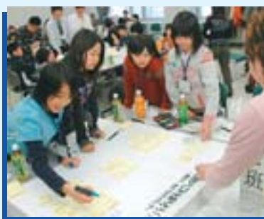
▲子どもごみサミット