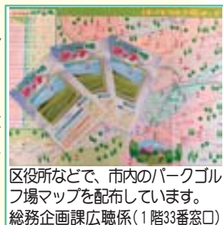
区役所などで、市内のパークゴルフ場マップを配布しています。 総務企画課広聴係(1階33番窓口)

道具の無料貸し出しについては、地域保健課健康推進係 ☎ 889-2400 (内線522)へ