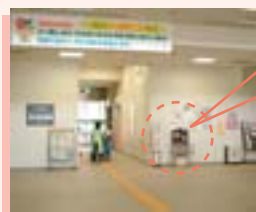
▲1階ロビーに設置してある「目安箱」。皆さんの“声”をお寄せください。

また、職員に必要な「聞く力」「伝える力」などのコミュニケーション能力の向上を図り、「共に考え、共に悩み、共に行動する」区役所になります。