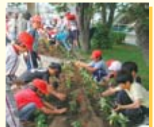
▲子どもたちも花苗植えに協力

町内会や学校などに花苗を配布するほか、ホテルの放流や観賞会を行います。また、ポイ捨て防止などの啓発や子どもを対象とした環境への関心を深める催しなどを行います。