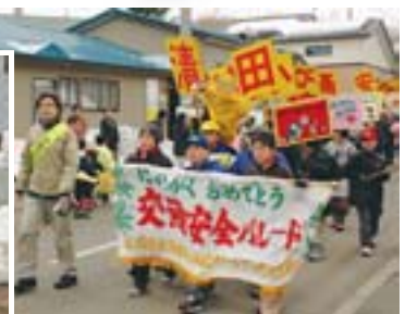
◀清田緑小と▲清田南小のパレード