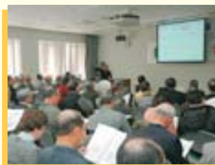
▲安全安心まちづくり講演会

防犯関係者を招いた講演会や研修会を開催するほか、ホームページや情報誌を活用し、防犯に関する情報を積極的に発信していきます。