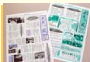
◀まちづくり情報誌「里美の風」

里美ふれあいクラブが中心となって、まちづくり講座の開催やまちづくり情報誌の発行などを行っています。