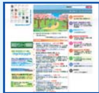
▲清田区のホームページ「きよたFan倶楽部」 http://www.city.sapporo.jp/kiyota/

清田区ホームページを充実させ、区の情報に適時提供します。また、区内各種団体によるホームページの立ち上げを支援し、互いにリンクすることなどで、より一層の情報共有に取り組みます。