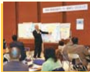
▲第3回ワークショップ

利用者や地域の声を建設計画に反映させるため、引き続き、区民からなる公募メンバーと専門家によるワークショップや公開講座を開催し「区民とつくる地区センター」の実現を目指して取り組みます。