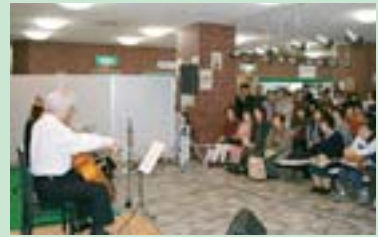
東区民センターロビーコンサート